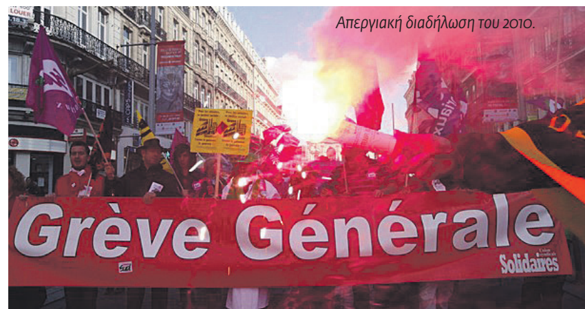
Απεργιακή διαδήλωση του 2010.

Οι νέοι άνθρωποι εμπλέκονται επίσης περισσότερο στον ξεσηκωμό. Αυτή τη βδομάδα είχαμε είτε καταλήψεις είτε αποκλεισμούς εισόδων σε πανεπιστή-