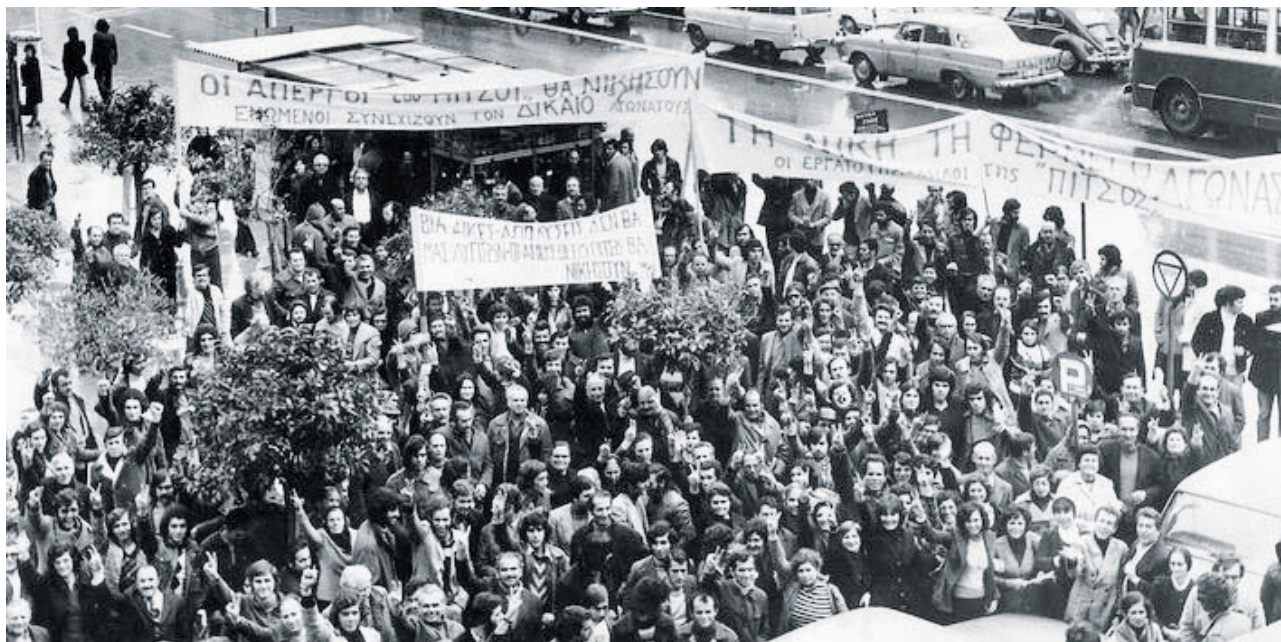
Συγκέντρωση των απεργών της «ΠΙΤΣΟΣ» έξω από την Εισαγγελία Πειραιώς, 15 Γενάρη 1976.

άμεσα δεμένη με τον χώρο δουλειάς, που έδινε τη δυνατότητα δημοκρατικής συμμετοχής των εργατών στη λήψη και στην υλοποίηση των αποφάσεων, ενώ αποδείχθηκε ικανή να κινητοποιεί πρωτοφανώς μεγάλο τμήμα της «βάσης» των σωματείων. Ήταν μια ριζοσπαστική ρήξη με την παράδοση των ομοιοεπαγγελματικών-κλαδικών σωματείων, παράδοση που συνδέονταν με την κυριαρχία της συνδικαλιστικής γραφειοκρατίας μέσα στο οργανωμένο εργατικό κίνημα. Η οργανωμένη πολιτική Αριστερά, με την εξαίρεση ενός μικρού τμήματος, που τότε θεωρούνταν η «εξτρεμιστική» πτέρυγα της άκρας Αριστεράς, δεν κατανόησε τη σημασία των εργοστασιακών σωματείων.