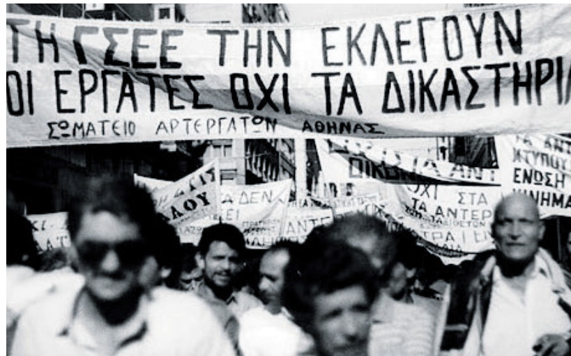
Γενική απεργία 14 Νοέμβρη 1985, την εποχή της ανταρσίας της ΠΑΣΚΕ.

Την ίδια γραμμή είχε επί της ουσίας και το ΚΚΕ. Στις 24 Ιούλη του '74, η ΚΕ του ΚΚΕ δήλωνε: «Ο ελληνικός λαός... έχει ανάγκη από μια ουσιαστική δημοκρατική αλλαγή που είναι ασυμβίβαστη με την κηδεμονία της λαομίσητης χούντας και των Αμερικανών... Το ΚΚΕ καλεί την εργατική τάξη, τους πατριώτες των Ενόπλων Δυνάμεων (σο: !!), όλο το λαό, να απαιτήσουν το σχηματισμό κυβέρνησης εθνικής ανάγκης απ' όλα τα κόμματα και οργανώσεις που αντιτάχθηκαν στη δικτατορία και καταπολέμησαν τις προδοσίες της. Αυτά πρέπει να αναλάβουν τη διακυβέρνηση της χώρας». Η σημερινή ηγεσία του ΚΚΕ, στα «συμπεράσματα» της αυτοκριτικής επανεξέτασης της περιόδου 1967-74, υπογραμμίζει: «Το βασικό πρόβλημα ήταν... η απόσπαση της πάλης για τα δημοκρατικά δικαιώματα και τις λαϊκές ελευθερίες από την πάλη για το σοσιαλισμό... (που) λειτούργησε καταστρεπτικά... Αρνητική πείρα προκύπτει και από την απομόνωση του αιτήματος για την "εθνική ανεξαρτησία"... με αποτέλεσμα να οδηγήσει το εργατικό-λαϊκό κίνημα να ταυτίζεται με μέρος της εγχώριας αστικής τάξης...» (Δοκίμιο Γ2, Συμπεράσματα,