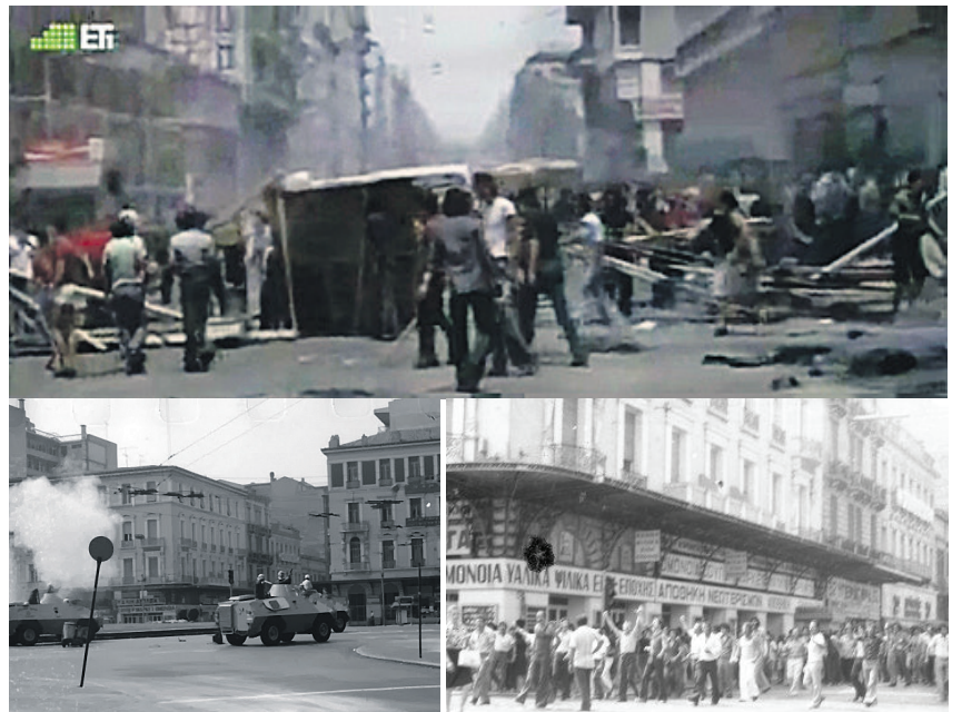
Από τη μαχητική συγκέντρωση των οικοδόμων στις 23 Ιούλη του 1975

Οι μάζες δεν έδωσαν στην κυβέρνηση Καραμανλή μια μακρά περίοδο σοβαρής «ανακωχής». Ένα μόλις μήνα μετά την ορκωμοσία του, η ιστορική απεργία στο εργοστάσιο της National Can, στη Μάνδρα της Ελευσίνας, άνοιξε τον άγριο εργατικό χορό της Μεταπολίτευσης. Στη National Can οι αδελφωμένοι Έλληνες και Πακιστανοί απεργοί σήκωσαν το πανώ που έλεγε: «Τα θέλουμε όλα!». Στο πλευρό τους, στην πύλη του εργοστασίου, βρέθηκαν κάποια τμήματα της φοιτητικής Αριστεράς, που