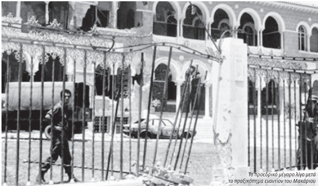
Το προεδρικό μέγαρο λίγο μετά το πραξικόπημα εναντίον του Μακάριου

ράς, θεωρούν την ΕΟΚΑ ένα εθνικοαπελευθερωτικό κίνημα, ενταγμένο μέσα στις παραδόσεις των μεγάλων αντιποικιακών αγώνων της εποχής. Ο Γρίβας δεν ήταν μόνο ένας έξαλλος ακροδεξιός εθνικιστής, ήταν ο επικεφαλής της «Χ», και βασικός πράκτορας των Εγγλέζων στην αδιάστακτη δράση τους ενάντια στο ΕΑΜικό κίνημα στην Ελλάδα. Ανάλογη ιδεολογικοπολιτική κατεύθυνση (αλλά και σχέσεις με την Ιντέλιτζενς Σέρβις) χαρακτηρίζουν και τα άλλα «πρωτοκλασάτα» στελέχη της ΕΟΚΑ (Π. Γιωργιάτσης κ.ά.). Η ΕΟΚΑ ποτέ δεν πήρε διαστάσεις μαζικού κινήματος. Η δράση της ήταν, κυρίως, τα φονικά «αποσπάσματα» και τα βομβιστικά σαμποτάζ. Η πλειοψηφία των θυμάτων της ήταν ελληνοκύπριοι αριστεροί αγωνιστές και τουρκοκύπριοι, στελέχη της και οιονδήποτε, ακόμα και γυναικόπαιδα. Όταν οι Εγγλέζοι χρειάστηκαν «ηρεμία» στην Κύπρο, προκειμένου να μεταφέρουν μαζικά στρατό προς τη Μέση Ανατολή και το Σουέζ, η ΕΟΚΑ έσπευσε να κηρύξει «ανακωχή». Δεν υπάρχει κανένα περιθώριο να συγχέεται αυτή η εθνικιστική οργάνωση με τα ριζοσπαστικά αντιιμπεριαλιστικά κινήματα στην Ασία και στην Αφρική.