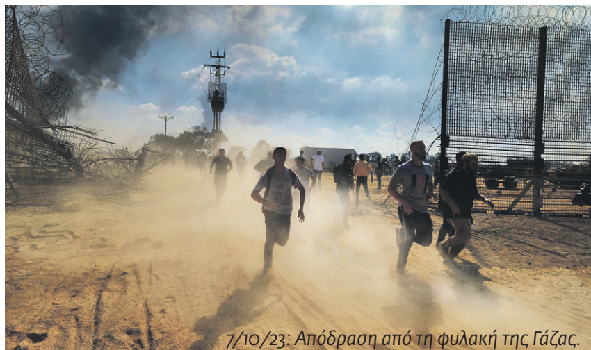
7/10/23: Απόδραση από τη φυλακή της Γάζας.

Στρατιωτικά, η Χαμάς και η ευρύτερη Αντίσταση έχουν αποδείξει ότι διαθέτουν την ικανότητα να διεξάγουν έναν μακρύ πόλεμο φθοράς. Είναι προφανές ότι μετά από ένα χρόνο διαρκούς πολέμου, θα έχει φθαρεί σε έμπειρα στελέχη και σε εξοπλισμό. Αλλά, όπως είπε ο Οσάμα Χαμντάν στο πρακτορείο AFP, «διατηρεί την ικανότητα να συνεχίσει», λόγω «της στρατολόγησης νέων γενιών» που αντικαθιστούν τους σκοτωμένους μαχητές. Αυτό (μαζί με την πολιτική μάχη της κοινής γνώμης) ίσως είχε στο μυαλό του ο Ισραηλινός στρατηγός Γκαντί Σαμνί όταν δήλωσε πρόσφατα ότι «Η Χαμάς κερδίζει τον πόλεμο. Οι στρατιώτες μας κερδίζουν κάθε τακτική μάχη με τη Χαμάς, αλλά χάνουμε τον πόλεμο και τον χάνουμε εντυπωσιακά». Ο εκπρόσωπος Τύπου του Ισραηλινού Στρατού, ο Ντανιέλ Χαγκάρι έχει δηλώσει από τον Ιούνιο: «Η Χαμάς είναι ιδέα. Η Χαμάς είναι κόμμα. Έχει ρίζες στις καρδιές των ανθρώπων.