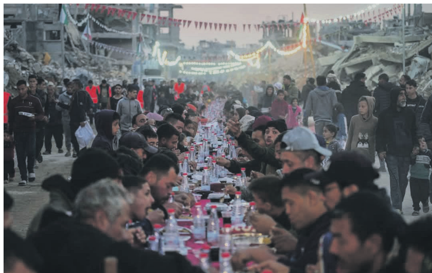
Έναρξη του Ραμαζανιού στην ερειπωμένη Γάζα. Σύμβολο ελπίδας.

Ο Γουίτκοφ, ο Ειδικός Απεσταλμένος του Τραμπ στη Μέση Ανατολή, πρότεινε επέκταση της κατάπαυσης του πυρός για τη διάρκεια του Ραμαζανιού και μέχρι το τέλος του Εβραϊκού Πάσχα (20 Απρίλη) με απελευθέρω-