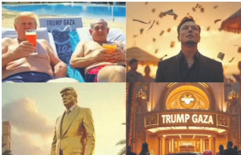
Καρέ από το βίντεο με το όραμα του Τραμπ για τη Γάζα. Σύμβολο χυδαιότητας.