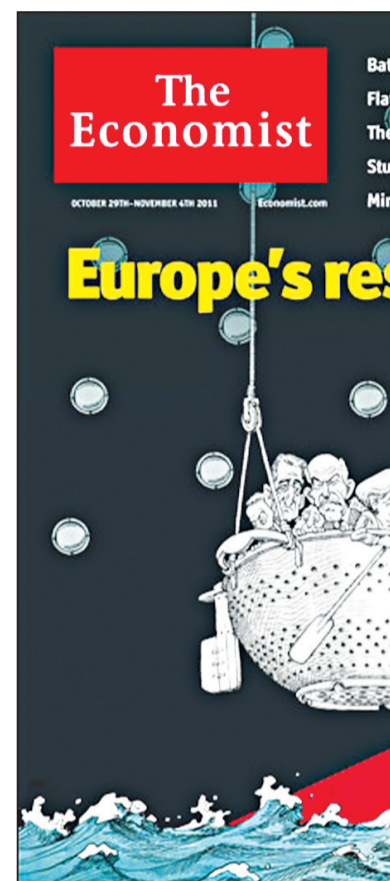
«Το σχέδιο διάσωσης της Ευρώπης»

Εκτός από τη λιτότητα, την ανεργία, τη διάλυση του κοινωνικού κράτους, η εργατική τάξη της Ευρώπης θα έχει να αντιμετωπίσει όλο και περισσότερο αντιδημοκρατικές θεσμικές αλλαγές. Επίσης, εξαιτίας των διαιρέσεων της άρχουσας τάξης, θα αντιμετωπίζει και τον εθνικισμό με τον οποίο οι άρχουσες τάξεις θα προσπαθούν να τη δηλητηριάσουν προκειμένου να ξεχάσει ότι ο εχθρός βρίσκεται εντός των συνόρων. Οι ευρωσυντηρητές είναι ίσως ακόμη μακριά, παρά τις προβλέψεις αμερικανικών εντύπων και αναλυτών, όμως η Αριστερά οφείλει να παίξει καταλυτικό ρόλο στη σφυρηλάτηση της ενότητας και της αλληλεγγύης όλων των Ευρωπαίων εργαζομένων ενάντια στα αφεντικά τους -ακόμη και στην περίπτωση που αυτά επιλέξουν να τσακωθούν με πολύ πιο βίαιους τρόπους.