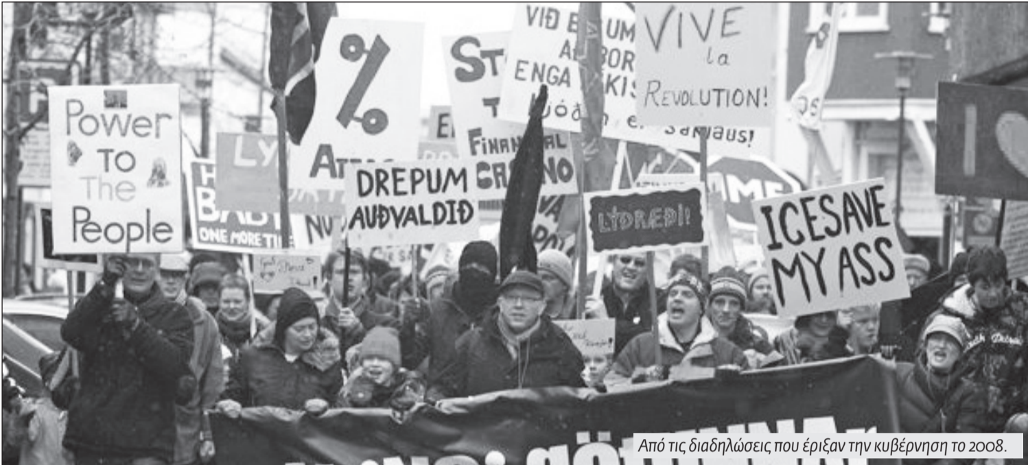
Από τις διαδηλώσεις που έριξαν την κυβέρνηση το 2008.