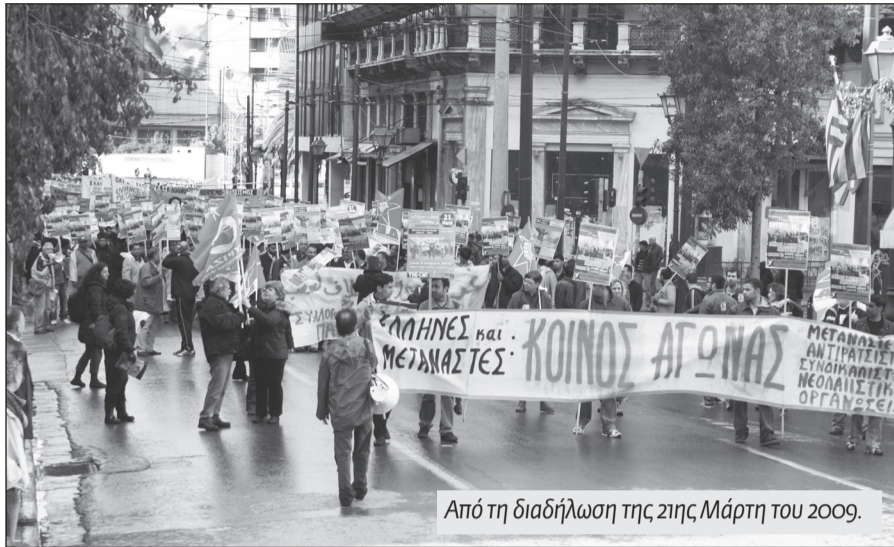
Από τη διαδήλωση της 21ης Μάρτη του 2009.

Στόχος της κεντρικής κινητοποίησης στις 24/3 είναι η μαζική παρουσία ντόπιων και μεταναστών εργαζομένων και νέων σε μια μεγάλη συγκέντρωση και διαδήλωση που θα δείχνει τη δύναμη της κοινής δράσης και της αντίστασης στο μνημόνιο και το ρατσισμό που προωθούν οι «από πάνω», με στόχο να μας διασπάσουν και να μας αποπροσανατολίσουν. Παράλληλα η κινητοποίηση φιλοδοξεί να αποτελέσει μια επίδειξη ισχύος απέναντι στα τάγματα εφόδου της Χρυσής Αυγής, που επιδιώκουν με τη βοήθεια της Αστυνομίας να μετατρέψουν το κέντρο της Αθήνας σε σφαγείο μεταναστών, όπου θα βασιλεύει ο φόβος και η σιωπή. Απέναντι στο σύστημα και τις πιο αντιδραστικές